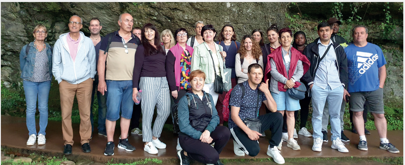
Sortie du pôle formation aux grottes préhistoriques de Sare