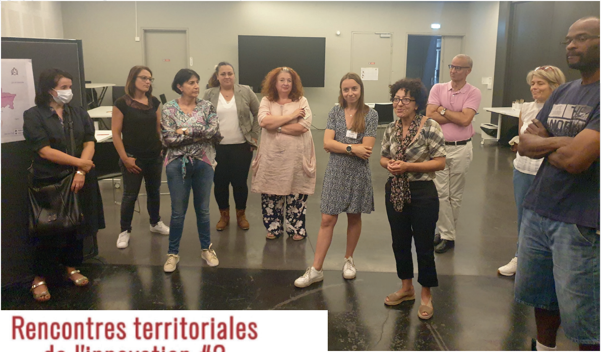
Rencontres territoriales de l'Innovation J2: "Repérer et former hors les murs: quels effets sur les publics, les pratiques et les organisations?"

Journée instructive et riche en rencontres avec des professionnels engagés qui redoublent d'ingéniosité pour: - mettre en place des pratiques innovantes au service de l'insertion socioprofessionnelle de tous les publics accompagnés, - envisager des collaborations sur différents territoires, - identifier des freins mais aussi des solutions pour la mise en place de nos actions respectives