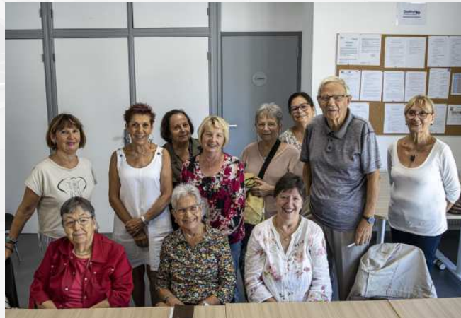
Une partie du collectif des bénévoles permanents présent à cette réunion.

L'activité marche, qui a été interrompue il y a déjà de nombreuses années, revient sous l'appellation : Fastoch'mar-