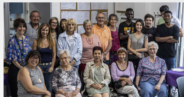
Les participants au recueil de recettes se sont réunis pour mettre la dernière main à la pâte.