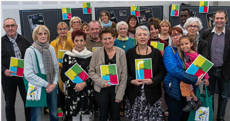
Les participants et responsables réunis pour la présentation du recueil.