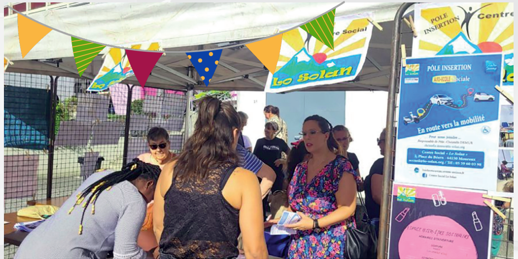
Tous les types d'associations de la ville étaient présents à ce forum.

Qu'elles soient sportives, culturelles, patriotiques, jeunesse, solidaires ou citoyennes, elles avaient toutes répondu présent.