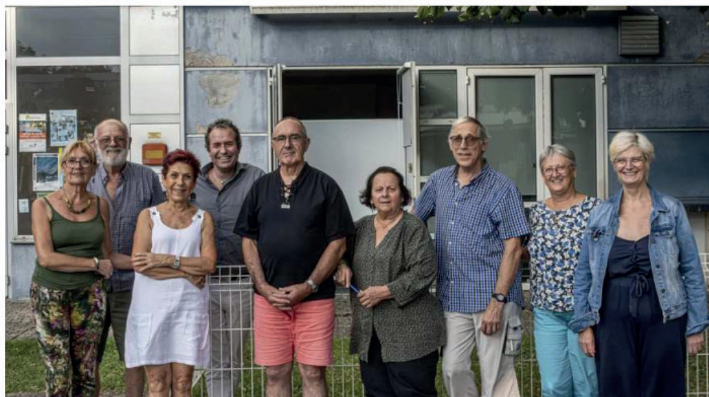
Les membres du bureau du centre social Lo Solan ont défini les futures orientations.

Un autre sujet mis en avant par les membres du bureau est